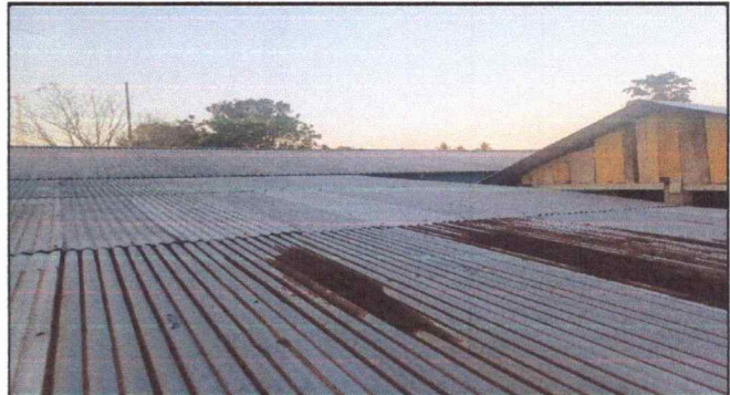
Foto 2: Cambio de techo por presentar filtraciones y deterioro de laminas.