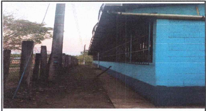
Foto1: Colocacion de corredor posterior en modulo 1.